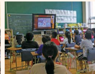
▲▶町内小学4年生～中学3年生までの生徒児童が、オンラインで講演会を視聴しました。(写真は鳩山小学校)