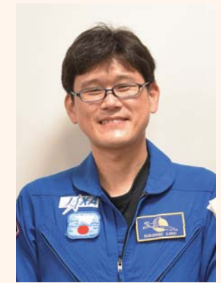
かないのりしげ 金井 宣茂氏

子どもたちに宇宙科学や宇宙開発への理解を深め、興味・関心を持ってもらうために、「宇宙に近いまち」である鳩山町で、7月12日(火)に、鳩山町町制施行40周年記念事業「子どもたちに夢をプロジェクト」JAXA宇宙飛行士による講演会「宇宙に関する職業に就こう!」を実施しました。 今回の講演会は、新型コロナウイルス感染症対策として、対面及び、YouTubeによるライブ同時配信のハイブリッド方式で実施しました。 会場には、鳩山中学校の生徒及び一般参加の計68人が参加し、オンライン配信は、町内の小学4年生から中学生3年生までと、全国からの一般参加者の計約400人が視聴しました。 講演は、講師の宇宙飛行士、金井宣茂氏により、スライドを使用しながら、「宇宙開発の現状」や「宇