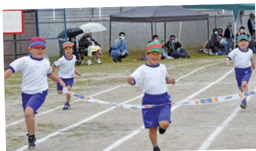
▲一人ひとりが全力を出し、走り切りました。(亀井小学校)