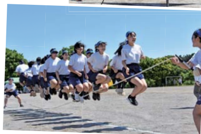
▲皆で気持ちを1つに高く跳ぶ「長縄跳び」(鳩山中学校)