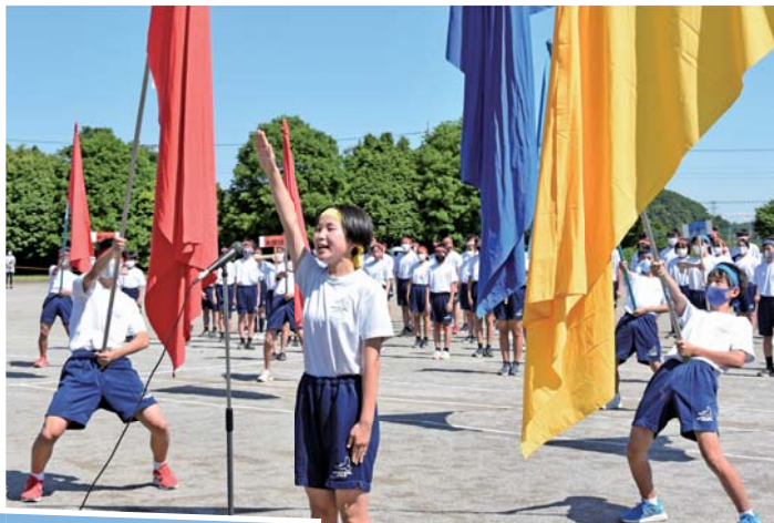
▲開会式の選手宣誓(鳩山中学校)

5月21日(土)に亀井小学校、鳩山小学校で運動会が、5月28日(土)に鳩山中学校で体育祭が開催され、各学校とも新型コロナウイルス感染防止対策から、午前だけの日程で競技等を行いました。鳩山中学校では、各学年にわたる混合チームを3団編成し、団長を中心に一致団結して、各自が力の限りを尽くしていました。亀井小学校で行われた運動会「かめリンピック」は、全児童が赤青に分かれ、今年のテーマ「走り出せ仲間とともに優勝へ!!」の下に、全力で競技に取り組んでいました。