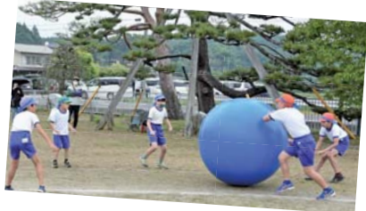
▶全員で息を合わせて大玉を送る「大玉送り」(亀井小学校)