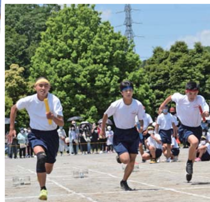
▶全速力でトラックを駆け抜けた「選抜混合リレー」(鳩山中学校)