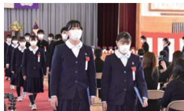
▲希望を胸に、式場を後にする鳩山中学校の卒業生たち

3月15日(火)、鳩山中学校卒業式が行われ、卒業生は、3年間過ごし、思い出がたくさん詰まった学び舎から、4月からの新たな生活の場に向けて、門出の日を迎えました。