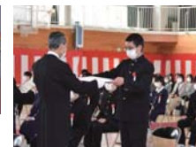
▲感染防止のため、各自の席で、卒業証書を受け取りました