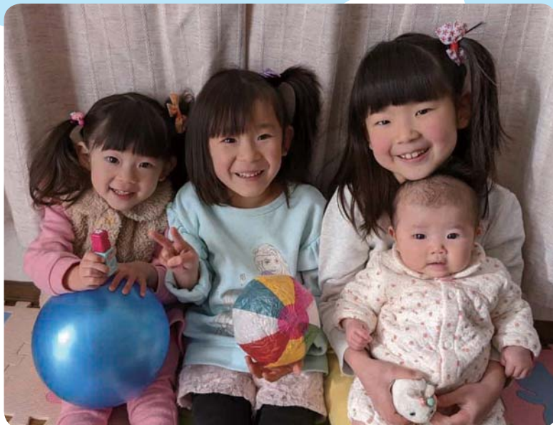
お風呂が大好きな4姉妹♡ 每晚、ワイワイ楽しく入っています♪

※投稿多数時は1号に複数枚掲載する場合があります。また、掲載月のご希望に沿えない場合があります。