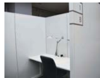
▲シェア・オフィスB (ドアなし小スペース)