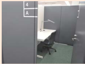
▲シェア・オフィスA (ドア付き広スペース)