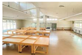
▲農産物直売所内の販売スペース。こちらで農産物、加工品、手芸品等の販売を行います。

農産物や加工品の出品を随時募集しています 直売所への農産物や、加工品の出品については、プレオープン期間中も含み、随時、募集しています。農産物等を出品いただける方、出品に興味がある方は、役場産業環境課または指定管理者までご連絡ください。 また、施設内には農産物の加工や調理が可能な加工室(菓子製造許可(パン・ケーキ等の製造が可能)、飲食店営業許可(弁当・惣菜の製造が可能)を取得予定)を設置します。なお、加工室の貸し出しについては、今後、加工室内の備品や機器の選定・導入を行ったうえで