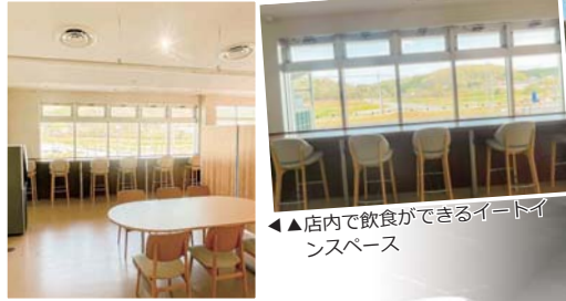
◀店内で飲食ができるイートインスペース

鳩山町特産品販売施設「鳩豆工房 旬の花」は、鳩山町上熊井農産物直売所オープンに伴い、令和3年9月30日(木)をもって閉館します。 「大豆で町おこし」「旬の味でもてなそう」をスローガンに、平成16年4月17日にオープンし、