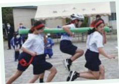
◀今年から取り入れた種目「お猿のかごや」