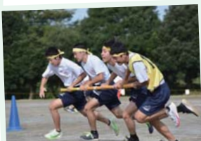
▲新型コロナの影響から細かいルールが変わった「台風の目」。皆のチームワークが問われます。