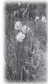
花菖蒲(以前のもの)