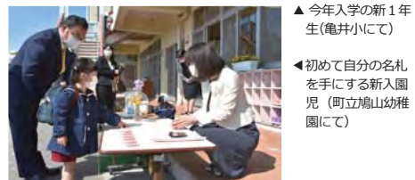
▲今年入学の新1年生(亀井小にて)