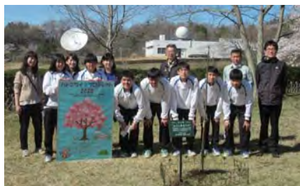
鳩山高校の生徒のみなさんが、地球観測センター内に桜の植樹を行いました。

県立鳩山高等学校の生徒が発案し、地域活性化につなげようと企画した「ハトミライ☆プロジェクト」の一環で、3月25日、同校生徒や町関係者が集まり、地球観測センター内に3本の「ふくしまサクラ」の植樹を行いました。