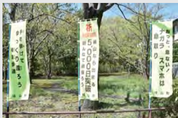
▲松ヶ丘3丁目H氏が作成し、町に寄贈されたのぼり旗。ニュータウン地内に設置され、交通安全を呼びかけています。

鳩山町では、2009年2月2日に町内で交通死亡事故が発生してから、交通死亡事故ゼロの状況が続き、昨年2月2日に継続満10年を達成しました。更に本年1月16日に、4,000日を見事突破。このゼロ継続日数は、現存する埼玉県自治体として最長記録で、県下第1位の誇れる偉業であります。