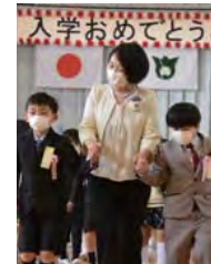
先生と一緒に新1年生は入退場しました(亀井小)

なお、今年度の新入生数は以下のとおりです。 鳩山幼稚園：11人、亀井小学校：13人 今宿小学校：34人、鳩山小学校：25人 鳩山中学校：77人