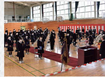
鳩山中学校 卒業式の様子

式後の教室では、卒業生たちが先生やクラスメイトへ感謝の気持ちなどを伝えあいました。