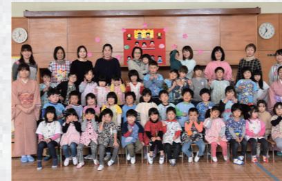
茶道の先生、ボランティアで参加した保護者、園児たちの集合写真