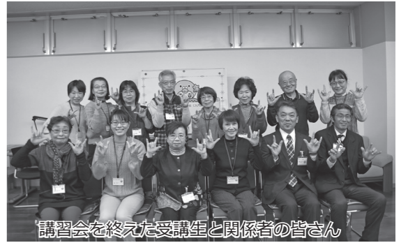
講習会を終えた受講生と関係者の皆さん

12月19日、ニュータウンふくしプラザで「手話講習会(入門編)」(町長寿福祉課・ニュータウンふくしプラザ主催)の閉講式が行われました。