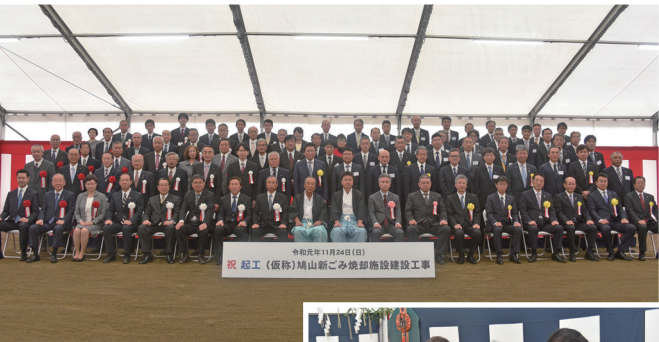
▲起工式へ出席された関係者の皆さん

約4.9㍍の敷地に建設されるごみ焼却施設は、地上5階地下1階建ての延床面積約1万平方㍍の規模となり、令和4年9月末日に竣工となる予定です。