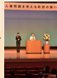
人権問題を考える町民の集い