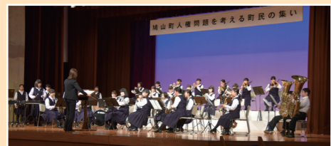
◀ 鳩山中学校吹奏楽部による演奏