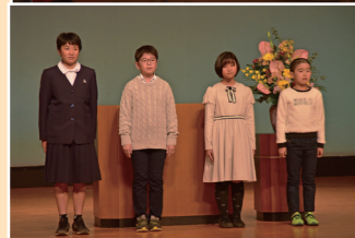
▶ 発表者の皆さん 人権作文の朗読