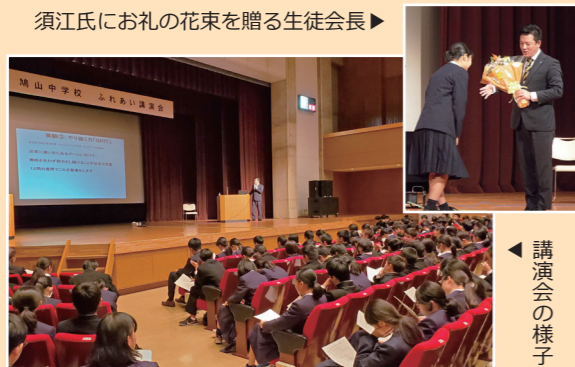
須江氏にお礼の花束を贈る生徒会長▶