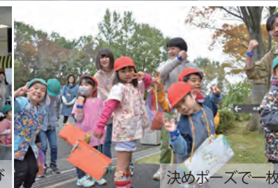
決めポーズで一枚