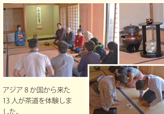
アジア8か国から来た13人が茶道を体験しました。

この体験会は、国立研究開発法人科学技術振興機構の令和元年度日本・アジア青少年サイエンス交流事業（さくらサイエンスプラン）の支援を受け実施しています。