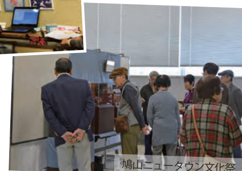
鳩山ニュータウン文化祭