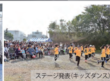
ステージ発表(キッズダンス)