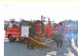
鳩山消防団による分列行進(写真左)。機械器具点検の様子(写真上)