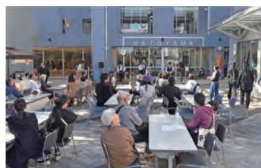
▲屋外ではバンド演奏なども行われました。