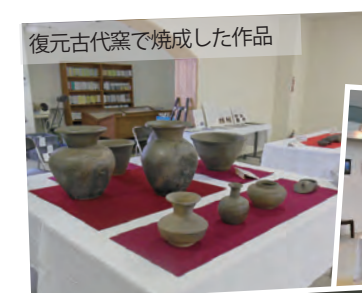
復元古代窯で焼成した作品

11月9日と10日には、町ふれあいセンターで、「鳩山ニュータウン2019文化祭」が開催されました。作品の展示、ステージ発表、餅つき大会などが行われた会場では、多くの人交流し、様々なジャンルの作品が会場を彩り、来場者は多くの力作に心を震わせました。