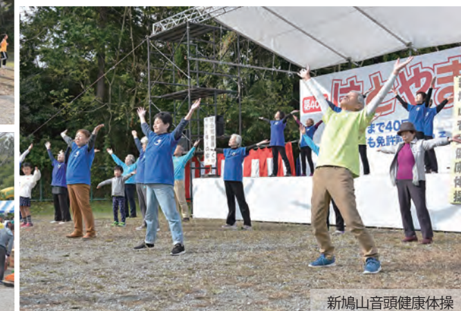
新鳩山音頭健康体操