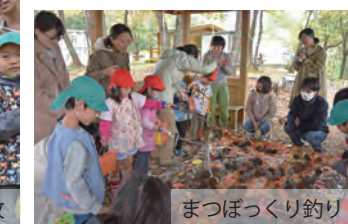
まっぼっくり釣り