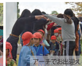
アーチでお出迎え