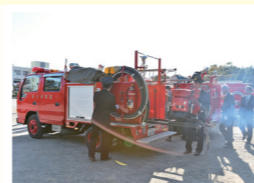
鳩山消防団による分列行進(写真左)。機械器具点検の様子(写真上)