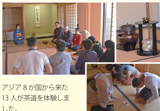
アジア8か国から来た13人が茶道を体験しました。

この体験会は、国立研究開発法人科学技術振興機構の令和元年度日本・アジア青少年サイエンス交流事業（さくらサイエンスプラン）の支援を受け実施しています。