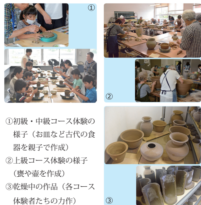
①初級・中級コース体験の様子(お皿など古代の食器を親子で作成) ②上級コース体験の様子(甕や壺を作成) ③乾燥中の作品(各コース体験者たちの力作)

参加者は「形を整えるのが難しかった」「自分で作って初めて他の人の作品を見ると、自分の作品と似たくほみなどがあり、こう作ったのかな?と想像しながら見ると楽しい」と話してくれました。制作された皆さんの作品は、復元古代窯で焼き上げます。詳細は、上記の「焼成実験見学会」をご覧ください。