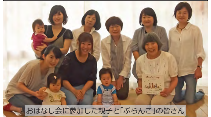
おはなし会に参加した親子と「ぶらんこ」の皆さん

町立図書館が開館するにあたり、町で読み聞かせボランティアを育成する講習会が開かれました。その時の受講生が有志で集まり、平成元年に「読み聞かせボランティアグループ」を結成し、このグループが後に、「おはなし「ぶらんこ」」になりました。