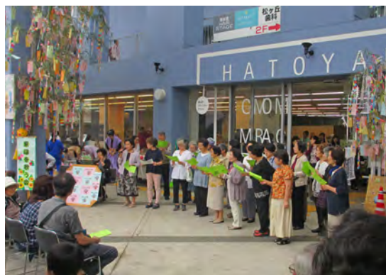
彩の国ボランティア体験プログラムの一環で中学生がイベントをお手伝い