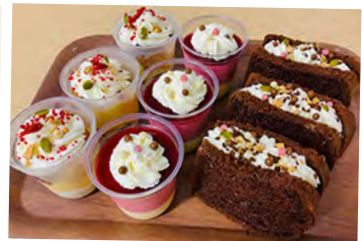
▲ PUTNEY BAKE さんが作ったシフォンケーキとマカロン(写真上)。