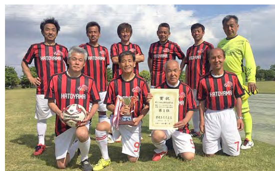
「サッカー壮年の部」において1位を勝ち取った鳩山町代表選手の皆さん

今年は、7種目の競技(サッカー、硬式テニス、卓球、9人制バレーボール、剣道、野球、ゴルフ)に、鳩山町の競技団体が出場しています。各競技団体は、日々の成果を発揮し、白熱した試合を繰り広げており、中でも5月19日に開催された「サッカー壮年の部」で、鳩山町が「1位」という輝かしい成績を残されました。