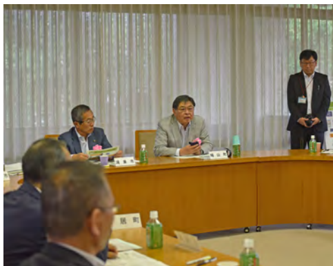
▲ 表彰式後に行われた意見交換会の様子

7月11日、県知事公館において、健康長寿に関する優秀な取組を行った市町村を表彰する「令和元年度 健康長寿優秀市町村表彰式」が行われました。