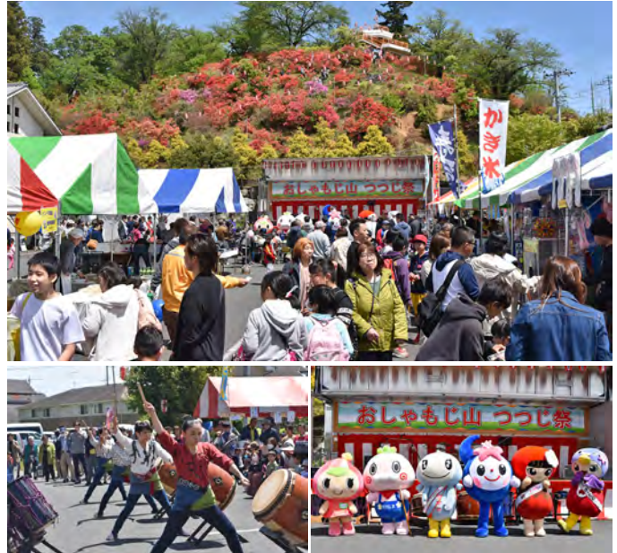
お馴染みとなった迫力ある太鼓演奏

来場者は、満開のつつじや、各種団体等による模擬店、和太鼓・ダンスなどのステージ発表を楽しんでいました。また、4月21日から5月4日までは、おしゃもじ山公園に設置された提灯により、つつじがライトアップされ、夜の公園を幻想的に彩り、訪れる人を魅了していました。