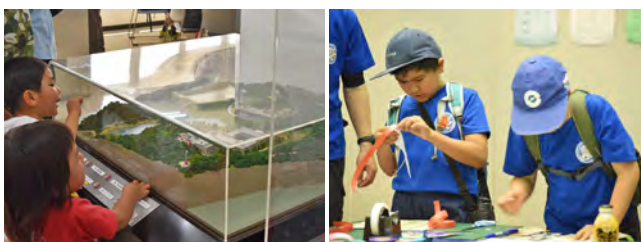
ジオラマに興味津々