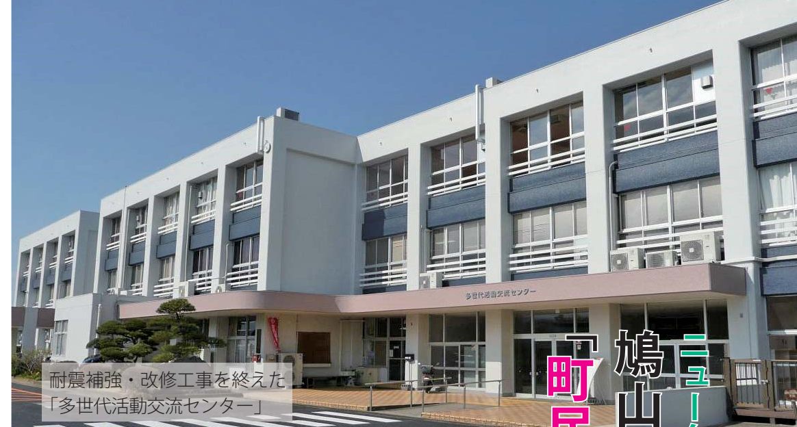
耐震補強・改修工事を終えた「多世代活動交流センター」

◆申込・問合せ：鳩山町教育委員会事務局 文化財分室(多世代活動交流センター2階) TEL296-3862、FAX296-4192