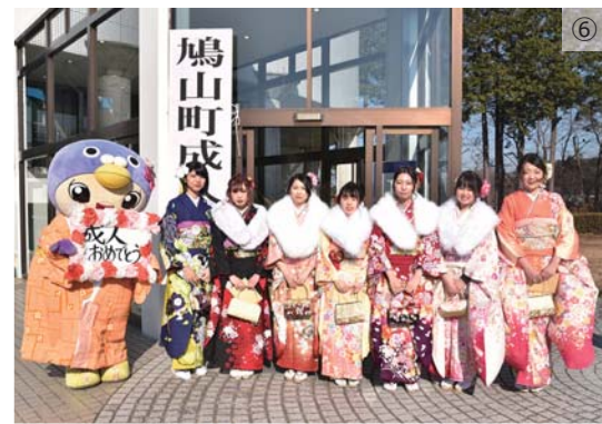
④中学校時代の学年主任や学級担任から近況報告や激励の言葉があった恩師のことば ⑤成人式実行委員によるアトラクションでの新成人へのインタビュー ⑥会場では友人との再会に、晴れ姿で記念撮影をする光景が多く見られました。