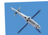
▲空撮用ヘリコプター