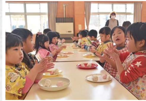
一生懸命にだんごを丸める園児たち

この行事は、養蚕が盛んだった頃、小正月に各家庭で行われていた風習を知ろうと実施しているもので、お米を提供いただく農家の方や調理などを行う保護者ボランティアの協力を得て、毎年行われています。飾り付けを終えた園児たちは、甘醤油で味付けされた団子を笑顔でほうばっていました。