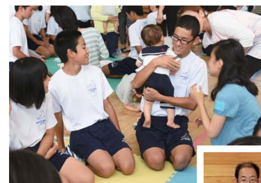
▲受賞の対象となった「乳幼児とのふれあい体験授業」

この賞は、「彩の国教育の日」の一環として埼玉県が実施しているもので、平成18年度から鳩山幼稚園、鳩山町社会教育委員、地元の親子などと連携協力して実施している「乳幼児とのふれあい体験授業」が受賞対象となりました。この授業では、3年生が、赤ちゃんの抱っこ体験や保護者との会話を通じて、命の大切さや、親に感謝する気持ちを学んでいます。