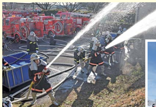
放水点検を行う消防団員