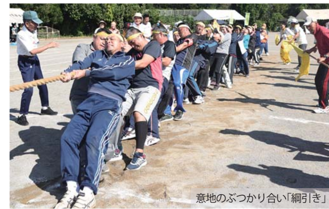
意地のぶつかり合い「綱引き」

10月7日、鳩山中学校第2グラウンドで、恒例となる「町民体育祭」が行われ、今年も、地区別に結成したチームが、対抗戦で力を競い合いました。 当日は、「対抗」「競技」「レク」の3種類で、各世代が参加できる多彩な種目が行われ、大会を通じて親睦を深めるとともに、大勢で運動することの楽しさを味わいました。なお、今年各地区別対抗競技は、第8(鳩山ニュータウン新自治会)チームが優勝、第2(今宿・赤沼)チームが準優勝となりました。