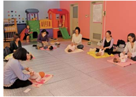
「ベビーマッサージ教室」(平成30年3月14日開催)