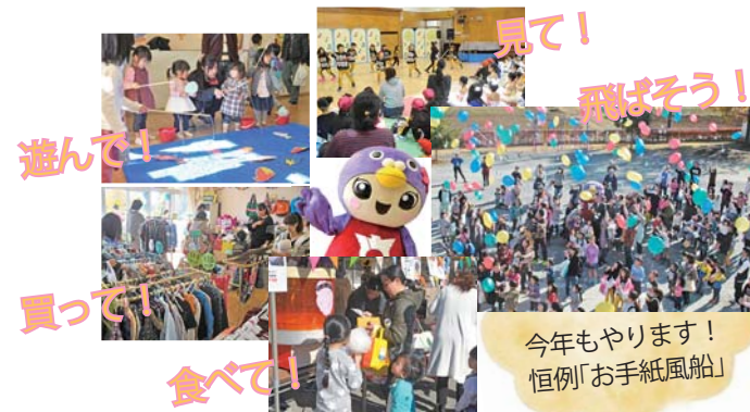
町ホームページも見てね♪