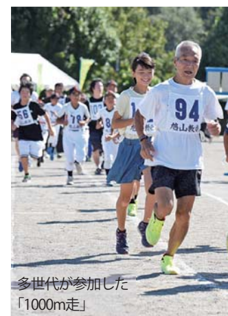
多世代が参加した「1000m走」