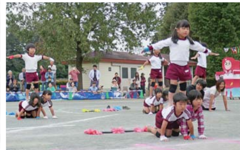
年長にじ組による組み立て表現

今年のテーマ「おまめ」にちなんだダンスや競技のほか、恒例のかけっこや綱引き、リレーなどに園児は力いっぱい取り組んでいました。保護者と楽しむプログラムもあり、会場にはたくさんの笑顔があふれました。