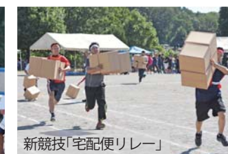
新競技「宅配便リレー」