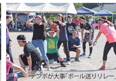
「テンボが大事」ボール送りリレー」