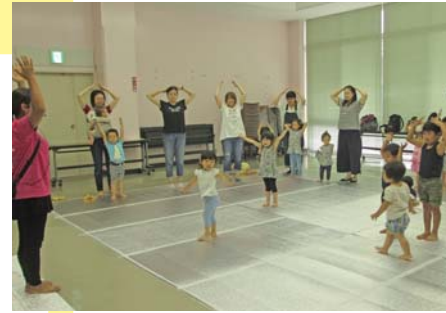
「わらべうたキッズマッサージ&親子ダンス教室」(7月26日開催)