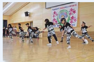
様々なステージ発表も行われました(写真はキッズダンス)

専用の歩数計やスマートフォンアプリを使って、ウォーキングなどでポイントを貯め、県の特産品等が自動抽選で当たる事業です。問合せは町保健センター(☎296-2530)まで。