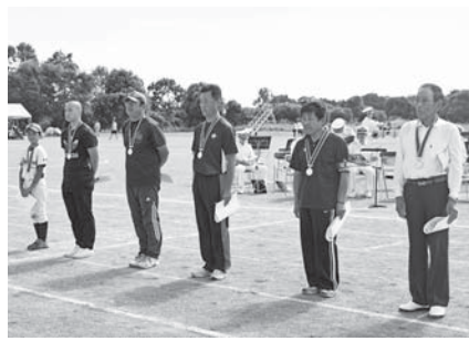
10月7日の「第61回町民体育祭」で表彰式が行われました。