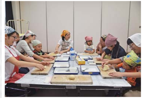
秋が旬の食材サツマイモやキノコなどを使いました。

この日作ったのは「季節のお野菜を使ったチーズフォカッチャ」。小さなお子さんでも作れるよう、包丁をあまり使わず、食材を手でちぎったり、生地をこねたりする作業に挑戦しました。自分たちで作った料理をみんなと一緒に食べ、楽しい時間を過ごしました。