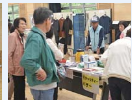
チャリティーバザー