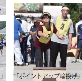
「ポイントアップ輪投げ」