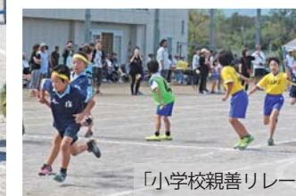
「小学校親善リレー」