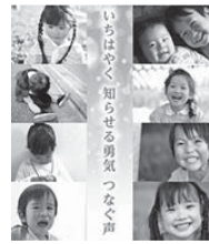
厚生労働省では11月を「児童虐待防止推進月間」と定め、児童虐待問題に対する社会的関心の喚起を図るため、広報や啓発活動をしています。

全国の児童虐待相談対応件数は平成29年度速報値で13万件を突破し、過去最多で増加の1途をたどっています。児童虐待は子どもの心身に深