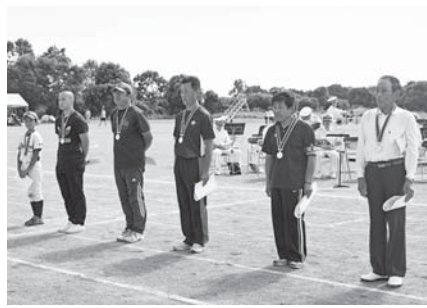
10月7日の「第61回町民体育祭」で表彰式が行われました。