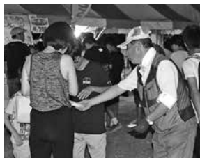
夏祭り会場では、啓発物品を配布しながら、子どもたちに声がけや見回り活動を行いました。▶