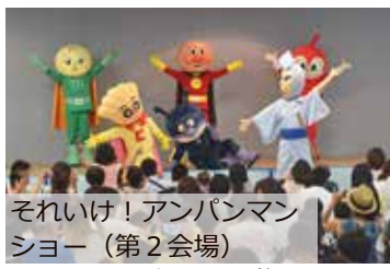
それいけ！アンパンマンショー（第2会場） © やなせたかし/フレーベル館・TMS・NTV