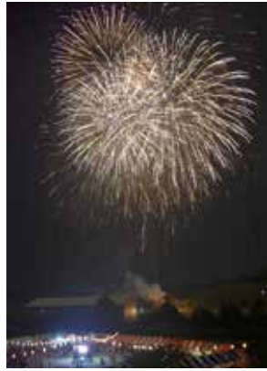
打ち上げ花火（第1会場）