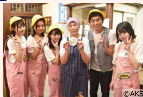
「鳩豆工房 旬の花」で記念撮影。メンバーは「鳩豆うどん」をおいしくいただきました。