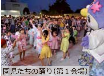
園児たちの踊り（第1会場）