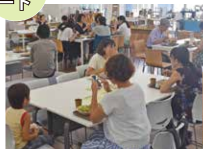
鳩山高校の生徒も応援 ▶