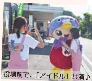
役場前で、「アイドル」共演♪

なお、放送日は9月28日(金)の午後10時～11時の予定です。(撮影当日の様子は、町公式フェイスブックでも掲載しています)