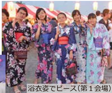
浴衣姿でピース（第1会場）