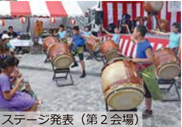
ステージ発表（第2会場）