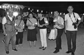
◀ 8月4日の鳩山町納涼夏祭りでは、パトロールをした皆さん

対象: 在宅介護をしている家族など 開設日時: 毎月第2・4火曜日 午前10時～正午 場所: 鳩山松寿園東館 地域交流スペース(松ヶ丘4-1-3) 問合せ: 町地域包括支援センター TEL 296-7700