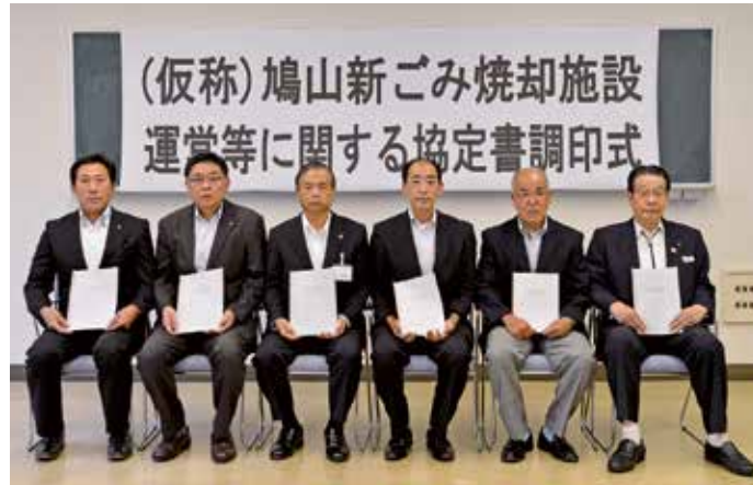
(写真左から)井上健次毛呂山町長、小峰孝雄鳩山町長、齊藤芳久埼玉西部環境保全組合管理者兼鶴ヶ島市長、大江浩太郎泉井区長、小久保光男上熊井区長、新井雄啓越生町長

このように、この協定書は、泉井・上熊井地区住民の皆さまや、地区対策協議会役員の皆さまの多大なるご協力と深いご理解のもと調印の運びとなったもので、今後整備される焼却施設の運営等に当たり、公害の発生を防止すると