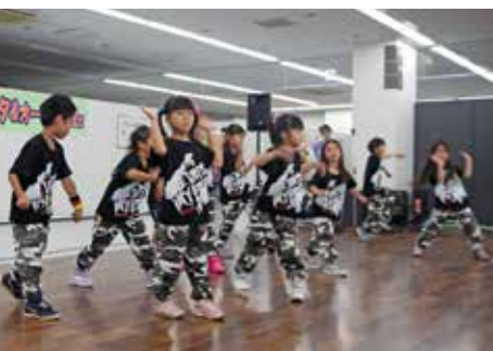
多彩なミニステージも来場者 を楽しませました。