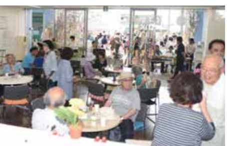
ニュータウンふくしプラザで おしゃべりを楽しむ人も。