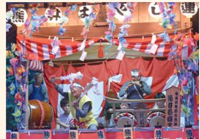
(写真上)大太鼓、あたり鉦、笛、踊りで構成される熊井毛呂神社屋台囃子。神楽殿で数時間にも及ぶ奉納が行われます。(写真右)担い手不足が危惧される中、確実に次の世代へ伝統が引き継がれています。