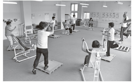
「筋力アップ」を目指そう