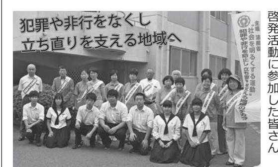
啓発活動に参加した皆さん

その後、広報車での呼びかけや各小中学校で「社会を明るくする運動作文コンテスト」への協力依頼を行いました。