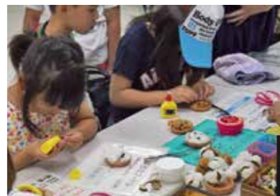
◀「綿花で作るブードル」づくりに取り組む子どもたち