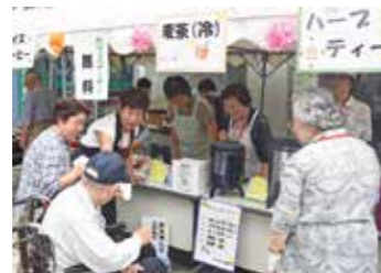
来場者には無料の飲み物が提供 されました。