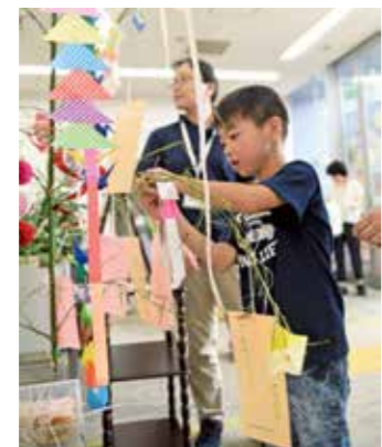
願いごとを書いた短冊を、笹に 飾りつける場面も。

7月8日、鳩山ニュータウン内にある鳩山町コミュニティ・マルシェで、ニュータウンふくしプラザのボランティアを中心とした「第6回七夕 & オープンカフェ～みんなの思い、願いが繋がる場」が開催され、会場は多くの人でにぎわいました。