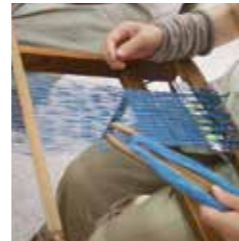
▲卓上織機での藍染めミニストールづくり

ワークショップは、小さなお子さんが参加できるものから、学生や大人も参加できるちょっと手の込んだものまで、多種多様なものが集まりました。参加者は、真剣に、そして楽しそうに、ものづくりに取り組んでいました。