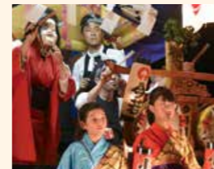
(写真左)若い世代も多く参加する今宿八坂神社祭囃子。(写真下)祭囃子を奉納しながら、山車が今宿地区内を巡行します。山車の曳き手は、子供会の子どもが中心です。

夏の風物詩である二つのお囃子は、どちらも町の指定無形民俗文化財です。時代は変わっても、皆さんの心意気と地元愛によって、素晴らしい伝統が守られています。