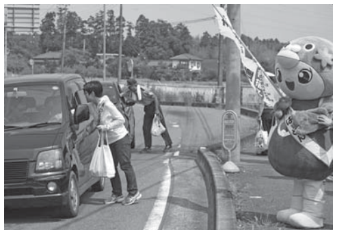
7月20日、大橋交差点で夏の交通事故防止運動に伴う街頭啓発活動を行い、交通安全を呼びかけました。