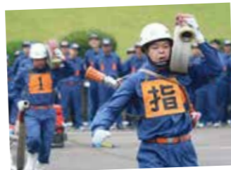
各団、長期に渡り練習を重ねてきました。

迅速さと安全性の消防技術を競う、第19回埼玉県消防協会西入間支部(毛呂山町、鳩山町、越生町)消防ポンプ操法大会が6月17日、毛呂山総合公園で開催され、3町の消防団員たちが訓練の成果を出し合いました。