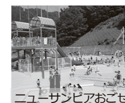
ニューサンピアおごせ