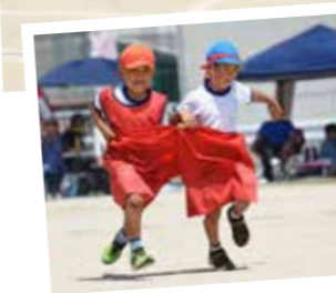
▲表現組体操「YELL! 届け 僕らの声」には感動の拍手が ◀“かわいい!”の声 が響いた「デカパン なかよしリレー」