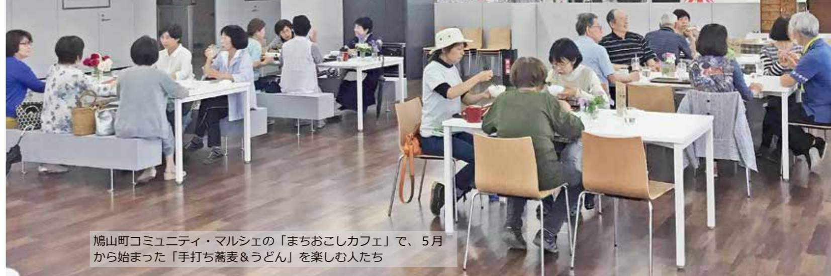
鳩山町コミュニティ・マルシェの「まちおこしカフェ」で、5月から始まった「手打ち蕎麦&うどん」を楽しむ人たち