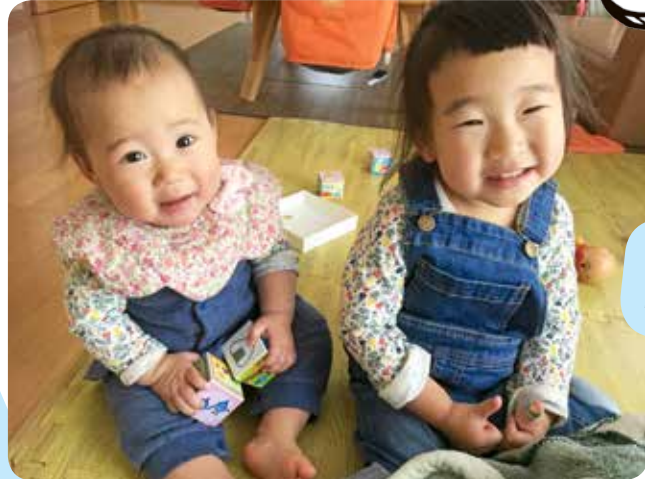
姉妹仲良く大きくなってね♡

※「うさぎちゃんの部屋」で読み聞かせを体験 できます。詳細は23ページをご覧ください。