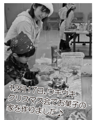
12月17日、ウキウキクリスマス会でお菓子の家を作りました。

青少年相談員とは、地域の子どもたちの相談・話し相手や遊び相手となって、子どもたちの