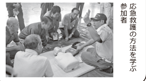
応急救護の方法を学ぶ参加者

家庭での消火を想定した訓練も行われました。 9月16日、町立今宿小学校で「第12回鳩山町防災訓練」が行われ、小用・大豆戸・赤沼・今宿・石坂二・鳩山団地の方々を中心に、多くの参加者が訓練を通じて災害時の行動などを学び、防災意識を高めました。 当日は、自宅から避難する訓練や、初期消火、負傷者の搬送、応急救護などの実施方法を学んだほか、煙の中での移動や、起震車で大地震時の揺れ方などを体験しました。