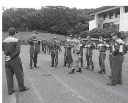
救助訓練を受ける消防団員の皆さん

また、7月2日に、毛呂山総合公園で「消防団新入団員教育訓練」を実施しました。毛呂山・鳩山・越生消防団に入団して3年以内の消防団員を対象に、心肺蘇生法、毛布と竹竿を使用した搬送法、基本結索、救助資機材取扱方法(チェンソー取扱い)の訓練を実施しました。さらに、消防団車両にドライブレコーダーを設置しました。