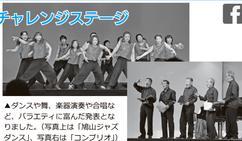
▲ダンスや舞、楽器演奏や合唱など、バラエティに富んだ発表となりました。(写真上は「鳩山ジャズダンス」、写真右は「コンプリオ」)

今年から実行委員会主催で行われたイベントには、多くの方が来場され、「どの発表もすばらしかった。来年もぜひまた開催してほしい」と話していました。