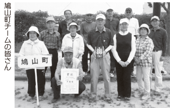
鳩山町チームの皆さん

5月6日、滑川町内で行われた「第27回比企地区グラウンド・ゴルフ大会」に、町内から2チームが参加しました。9市町村から18チーム、総勢108人が参加したこの大会で、「はーとんクラブA」の皆さんが準優勝に輝きました。