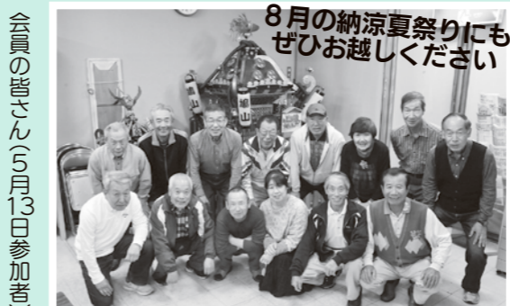
会員の皆さん(5月13日参加者)

—活動内容は— 毎月1回、定例会を開催しているほか、主に鳩山納涼夏祭り、松寿園夏祭り、高坂丘陵夏祭りで見こしを担いでいます。また、鳩山ニュータウン文化祭の手伝い(餅つきなど)も行っています。 —みこしと会の魅力は— 重量のあるみこしは、心一つにして担がないと危険ですが、その一体感を見る人の心も動かします。また、会の活動は、「日本人の心」を感じさせてくれるだけでなく、みこしを知らない子どもたちへの文化の継承という意義深いものでもあります。 —メッセージをお願いします— 皆さん明るく楽しい会です