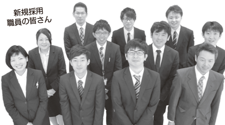
新規採用 職員の皆さん