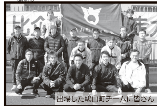
出場した鳩山町チームに皆さん