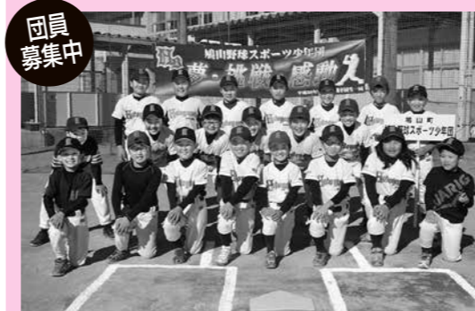
現在、小学1～6年生が在籍しています。(2月4日の参加者)