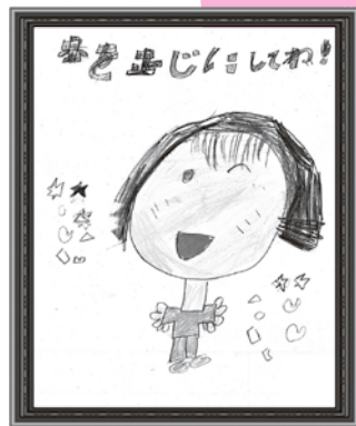
こじまれおくん (小学1年生)

このコーナーでは、町立図書館「らいぶらりい・メイト」投稿コーナーの絵などを紹介しています。