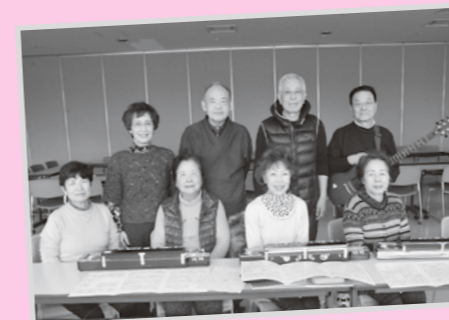
会員の皆さん(12月1日参加者)

大正琴の譜面は、音符でなく、楽器に配置された数字が記されたものです。そのため、音楽経験のない方でも分かりやすく、始めやすい楽器です。演奏曲は馴染みのある昔の楽曲が多く、大正琴の音色がパートが出ず音が合わさると素敵なアンサンブルとなり、楽しい気持ちになります。