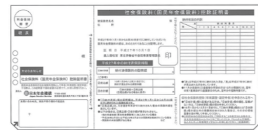
国民年金保険料控除証明書の見本(表面)

また、ご自身の保険料だけではなく、配偶者やご家族の負担すべき国民年金保険料を支払っている場合、その保険料も合わせて控除が受けられます。 ◆控除を受けるには 社会保険料控除を受けるため