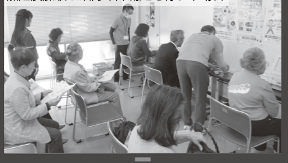
加速度脈波 & 活力年齢測定を行う来場者