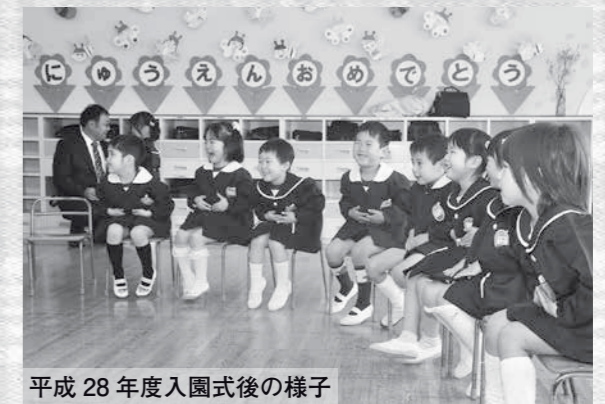
平成28年度入園式後の様子