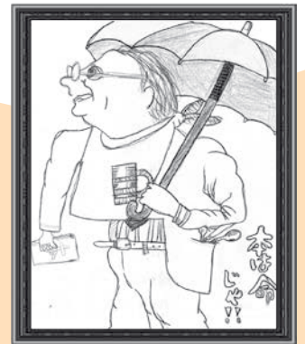
おがわ てんたろうくん (小学6年生)