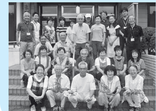
鳩山町民生委員・児童委員協議会の皆さん

障害者福祉部会では、今後も交流会等を企画し、地域の障害者支援施設との交流を深め、支援につなげていきます。