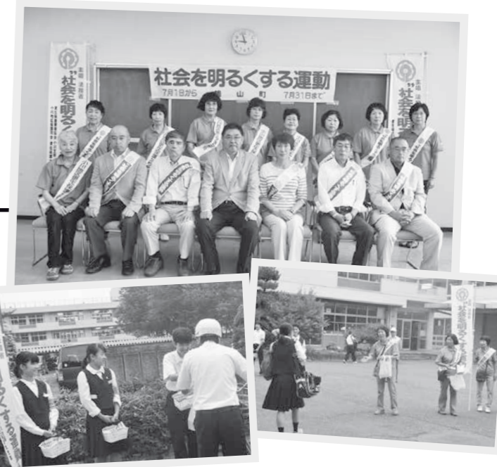
(写真上)出発式で活動の誓いを立てた皆さん。 鳩山中学校内で啓発活動を行う生徒会の皆さん(写真左下)と保護司・更生保護女性会の皆さん(写真右下)

その後、広報車で町内を巡回し呼びかけを行ったほか、各小学校を訪問し、「社会を明るくする運動作文コンテスト」への協力を依頼しました。