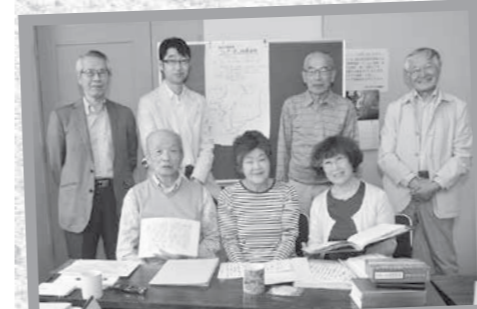
会員の皆さん (4月23日参加者)

―活動内容は― 江戸時代を中心とした村方文書や文学作品、庶民の手記など、谷口先生が選んだテキストを使用し、「くずし字」で書かれた古文書を読み解いていきます。単に文字を読むだけでなく、その文書の時代背景なども学び、考察しています。 ―古文書の魅力は― 数百年前の文書そのものを見られる感動や、字を読み解けたときの喜びに加え、学校で学んだこと以上の、自分の知らない歴史を知ることができます。また、文書から当時の世相を考察したり想像したりする楽しみもありますし、先生の解説や会員同士の意見交換も楽しみでとても勉強になり、新たな発見にもつながります。 ―メッセージをお願いします― 古文書を読めるまでにはそ