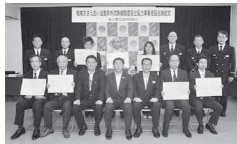
締結式には、鳩山町からは7事業所の方々にご参加いただきました。