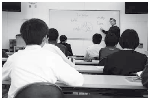
英語を学ぶ参加者(12月25日)