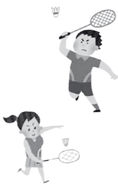
鳩山町体育協会主催 秋季バドミントン大会

主管 町バドミントン連盟 対象 ①町内在住・在勤の一般社会人 ②町内在住・在学の高校生以上の方 ③町内のクラブに属している方 日時 10月18日(日) 午前9時