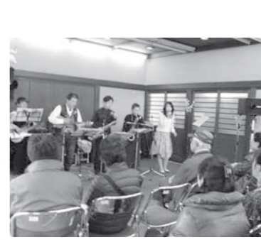
バンド演奏を楽しむ姿も

4月4日、梅沢集会所（赤沼地内）で「さくらまつり」が行われ、会場周辺の桜を見ながら集まった参加者が、音楽や露店販売などを楽しみました。 来場者は、カレーライスや豚汁、まんじゅうなどを買って食事をしたり、切花、新鮮野菜などの買い物したりしたほか、計5組のバンドによるスペシャルライブの演奏を楽しみました。