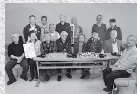
『鳩山囲碁クラブ』の皆さん（4月1日参加者）

―活動内容は― 囲碁を通じて、頭の体操や参加者の交流を図っています。年4回の大会や、周辺大学との親善試合のほか、のびのびプラザでの小学生とのふれあい活動や、介護施設への訪問など、ボランティア活動も行っています。平成26年からは、毎週土曜日に、初心者の方がより気軽に参加できるように「ふれあい碁」も開催しています。 ―囲碁の魅力は― 「頭の格闘技」とも言われる囲碁は、とにかく頭を使うため、子どもにとっては頭を良くし、高齢者にとってはボケ防止の効果があります。一見とっつきにくいですが、ルールは簡単で、2人いればできる気軽さもあります。一方で奥が深く、飽きのこない