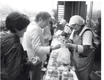
食べ物を買う来場者