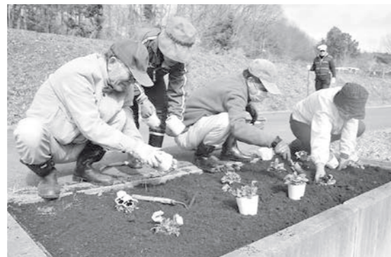
色合いなどを考えながらパンジーを植え付ける「チェリーセージの会」の皆さん

チェリーセージの会が農村公園への散策道にパンジーを植え付けました。 2月20日、訪れる人を楽しませようと、農村公園内の一角でハーブガーデンを管理している「チェリーセージの会」の皆さんが、同園付近の散策道約300mに、パンジー110株を植え付けました。 会の活動日に合わせてボランティアで行った今回の植え付けで、会の皆さんは、花の色合いや間隔などを考えたり、朝晩の冷え込みを心配するなど、花への愛情たっぷりで作業していました。