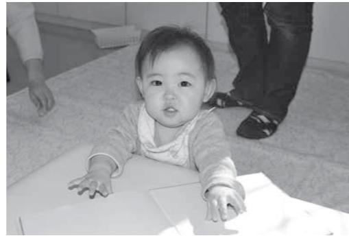
からさわ える ちゃん おうちでは 元気に叫んでいます

チェリーセージの会が農村公園への散策道にパンジーを植え付けました。 2月20日、訪れる人を楽しませようと、農村公園内の一角でハーブガーデンを管理している「チェリーセージの会」の皆さんが、同園付近の散策道約300mに、パンジー110株を植え付けました。 会の活動日に合わせてボランティアで行った今回の植え付けで、会の皆さんは、花の色合いや間隔などを考えたり、朝晩の冷え込みを心配するなど、花への愛情たっぷりで作業していました。