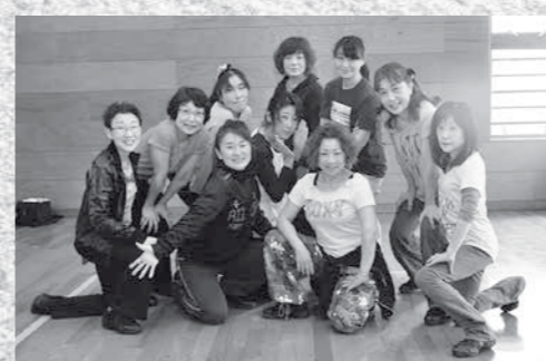
「鳩山ジャズダンス」の皆さん(2月24日参加者)

―活動内容は ストレッチを含む基礎トレーニングで徐々に体を温めた後、ゆっくりとした曲やアップテンポの曲など、さまざまな曲でダンスを練習しています。主に年に1度、町主催の「だれでもチャレンジステージ」で練習の成果を発表しています。 ―ダンスの魅力は ダンスをすることで体がほぐれ、体力もつきます。余計なことを考えずに踊って、汗をかくことはとても気持ちがいいです。ダンスの振り付けの難しさはありますが、先生が先導して、丁寧に教えてくれますので、自然と皆で一致団結した踊りとなり楽しいです。また、これまで知らなかった曲と出会い、それに合わせて踊れる楽しさもあります。