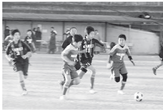
ボールを奪い合う選手ら（Aクラス予選。亀井対中山の試合にて）

1月10日から12日にわたり、梅沢運動場と亀井運動場で「第34回比企郡サッカー少年団鳩山大会」が開催され、比企郡内25チームが参加し、日頃の練習の成果を競い合うとともに、試合を通じて交流を深めました。