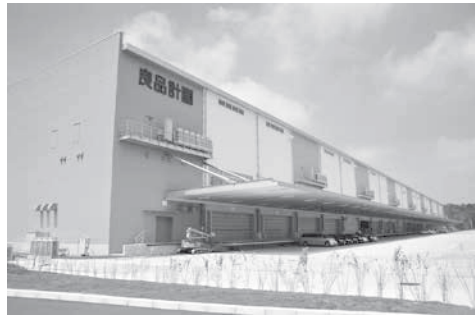
奥田地に誘致した(株)良品計画鳩山センターが本格稼働(11月)