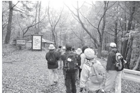
東松山市との連携事業「森の魅力発見！森林セラピーウォーキング」を開催(11月)