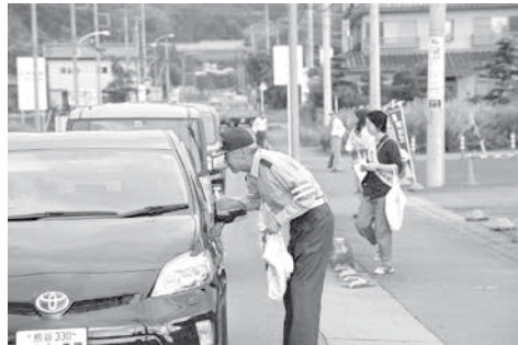
町内交通事故死亡者ゼロの更新日数が7月に2,000日を突破