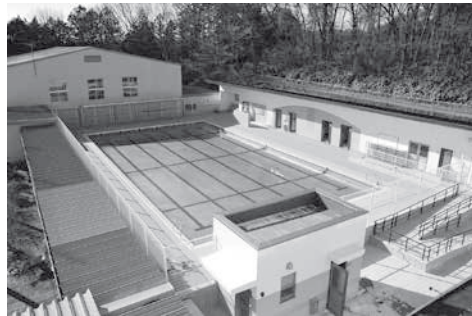
町内小中学校すべてのプールを緊急給水システム付き浄水型へ改築(2月)