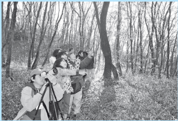
石坂の森で鳥を観察する児童たち

観察会を終えた学生（児童）は、同日、東京電機大学鳩山キャンパスで行われた修了証書授与式で、柏崎学長から、激励の言葉とともに修了証書を受け取りました。