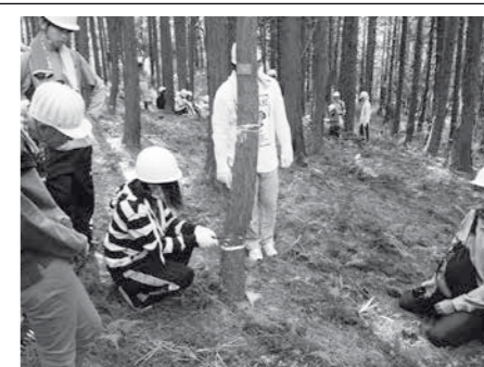
ヒノキの伐倒を体験する学生ら

10月4日、石坂の森で、山村学園短期大学保育学科が、NPO法人里山環境プロジェクト・ほとやまの協力のものと、里山保全体験学習を実施しました。7月から始まった体験学習の3回目となったこの日、学生たちはヒノキの伐倒を体験しました。(第1回の7月には学内学習を、第2回の9月には石坂の森で自然観察と草刈り体験を行いました。)